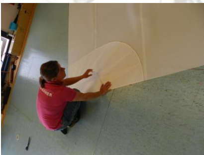
Bezig met de schoothoek vast lijmen

De HA fok is een hoog smal voorzeil dat de voordriehoek op een zeiljacht maximaal vult maar niet voorbij de mast komt. Een HA fok wordt standaard in horizontale banen (cross-cut) gesneden. Het doekgewicht is wat zwaarder dan bij een rol-reefgenua. Op nieuwe schepen wordt de kleinere en vlakkere HA fok steeds vaker als standaard voorzeil bijgeleverd in plaats van een rol-reefgenua.