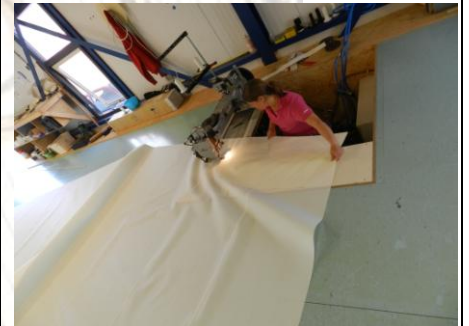
Afwerking van de schoothoek

Het is een allround voorzeil dat met aanwakkerende wind kan worden gereefd tot stormfok. Het zeildoek en de afwerking is er meer dan zwaar genoeg voor en het vlakke profiel zorgen ervoor dat de vorm optimaal blijft.