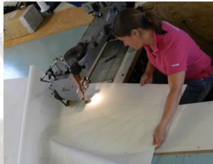
De schoothoek onder de naaimachine.

Het profiel van het zeil is beter dan een gedeeltelijk ingerolde rol-reefgenua. Met de HA fok kunt u dus aanmerkelijk hoger aan de wind zeilen. Dit heeft zich al bewezen bij enkele proefvaarten van afgelopen week